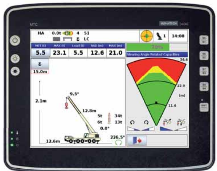
Tragfähigkeitsradar IC-1 Plus