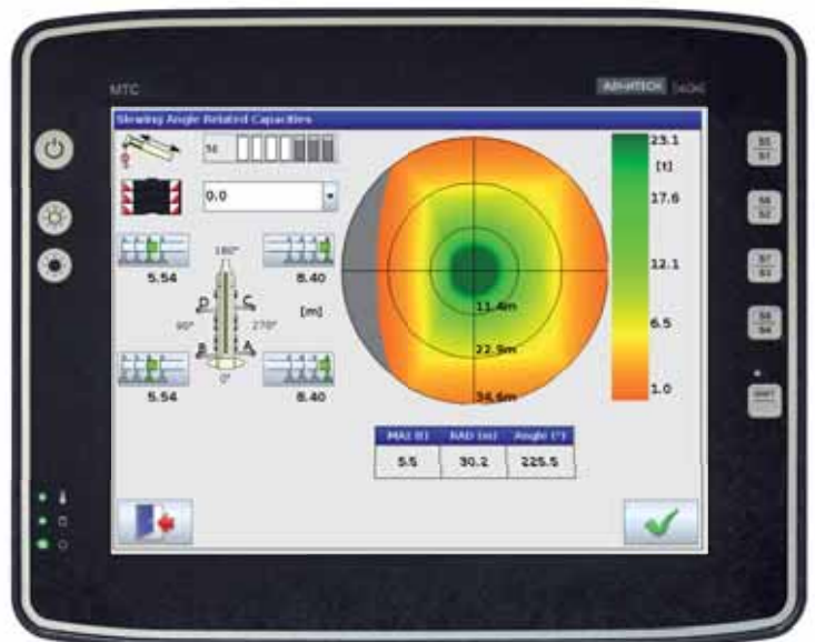
On-Board-Simulation mit dem IC-1 Plus Steuerungssystem