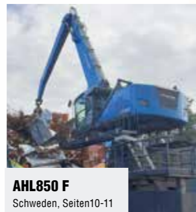
AHL850 F Schweden, Seiten 10-11