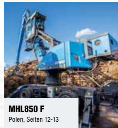
MHL850 F Polen, Seiten 12-13