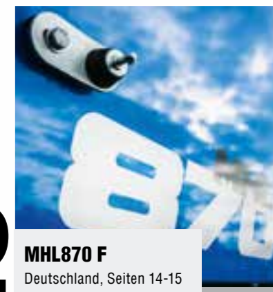
MHL870 F Deutschland, Seiten 14-15