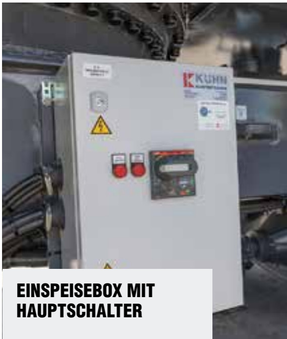
EINSPERSEBOX MIT HAUPTSCHALTER