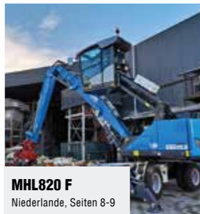
MHL820 F Niederlande, Seiten 8-9