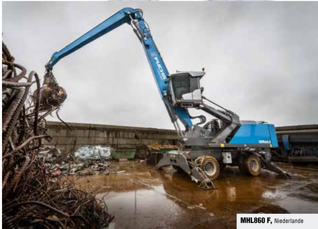
MHL860 F , Niederlande