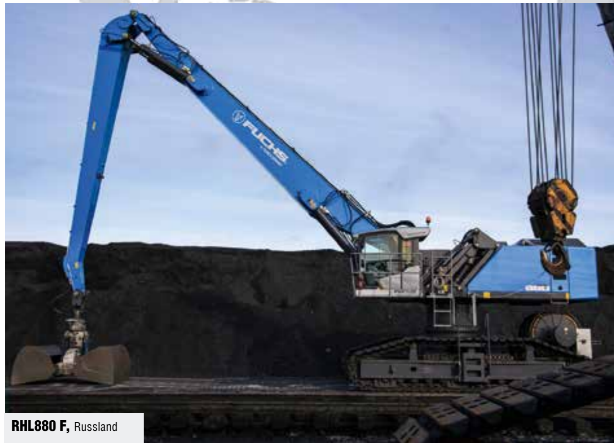
RHL880 F , Russland