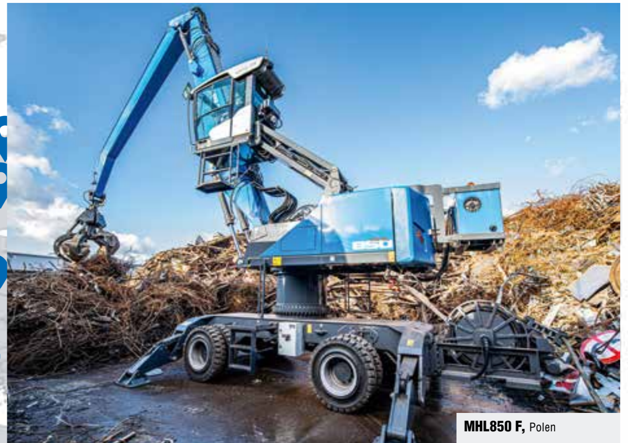
MHL850 F , Polen