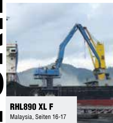
RHL890 XL F Malaysia, Seiten 16-17