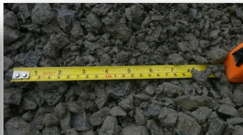
预筛分 0-32mm (with high clay content)