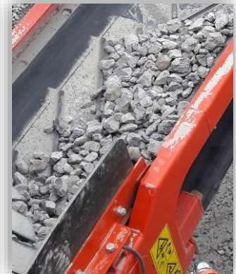
オーバーサイズプラス製品