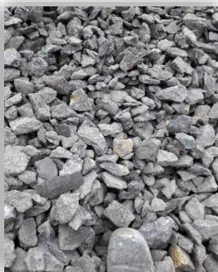
Materiali in ingresso

Consumo di carburante medio Motore: CAT C4.4 Tier 4 98 kW (131 CV) a 1800 giri/min Litri all'ora: 14 l/h (3,7 US gal/h) (media T-Link)