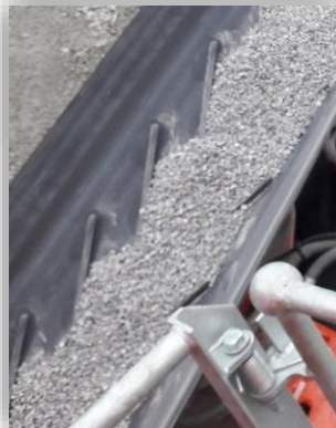
Producto de grado medio