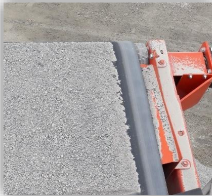
Producto de finos