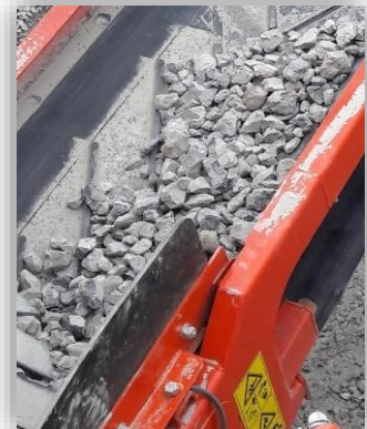
Producto de tamaño excesivo superior